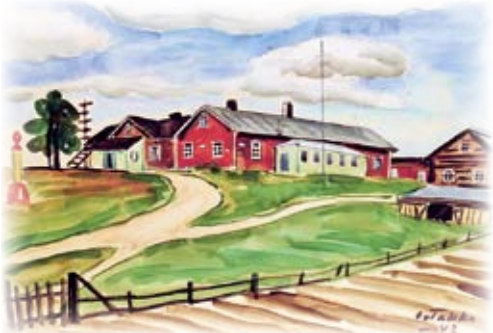
Reetrikin mäki v. 1943.

Perheyrittys kestinnyt vieraitaan vuodesta 1924 alkaen