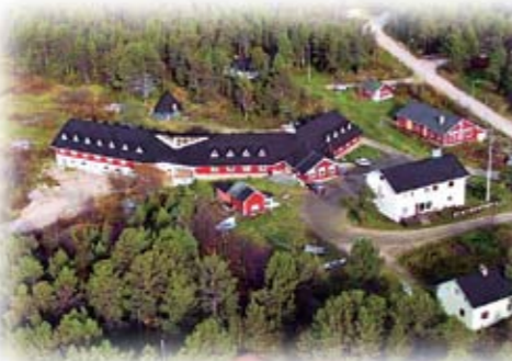
Majatalon mäki 2000-luvulla.